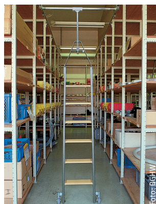
Rollleiter für Regalgänge; quer zur Laufrichtung verschiebbar