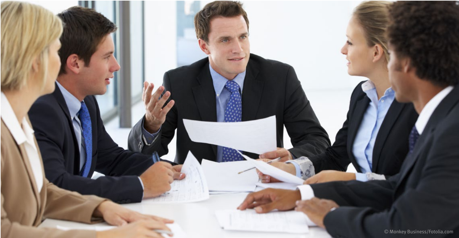
Abb. 2: Unternehmer und seine Führungskräfte bei der Delegation von Unternehmerpflichten

Wie ist der Arbeitsschutz im Betrieb organisiert, in welcher Rolle befinden sich Sicherheitsbeauftragte, welche Rechte und Pflichten haben sie und wie ist die Verantwortung definiert, die sie tragen? Welche Ziele und Aufgaben haben Sicherheitsbeauftragte und wie werden sie darauf vorbereitet? Die Beantwortung dieser grundlegenden Fragestellungen ist Voraussetzung für das Tätigwerden der Sicherheitsbeauftragten.