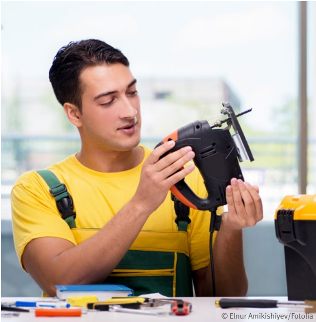
Abb. 13: Sichtkontrolle