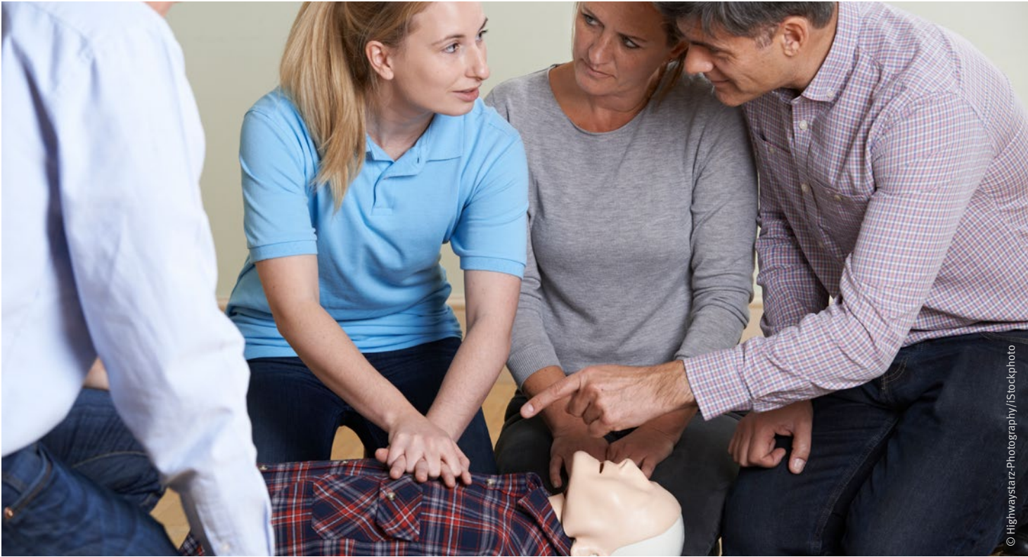
Abb. 8: Erste-Hilfe-Ausbildung im Betrieb

Ein wirksames Tätigwerden der Sicherheitsbeauftragten setzt deren fachliche Nähe zu den Arbeitsbereichen der Beschäftigten im eigenen Zuständigkeitsbereich voraus. Die notwendige fachliche Nähe ist zum Beispiel dann gegeben, wenn die Sicherheitsbeauftragten und die Beschäftigten dauerhaft gleiche oder ähnliche Tätigkeiten ausüben und wenn den Sicherheitsbeauftragten die Beschäftigtenstruktur im Zuständigkeitsbereich, insbesondere im Hinblick auf Qualifizierung und Sprache bekannt ist. Neben der fachlichen Nähe sind aber auch Kenntnisse der Sicherheitsbeauftragten im Arbeitsschutz innerhalb des Zuständigkeitsbereichs erforderlich. Ein ausreichendes Arbeitsschutzwissen verschafft ihnen bei Gesprächen mit Führungskräften und innerhalb des Kollegiums Achtung und Vertrauen. Dazu gehören unbedingt die Ergebnisse der Gefährdungsbeurteilung aus dem jeweiligen Tätigkeitsbereich. Das benötigen Sicherheitsbeauftragte, um ihre Kolleginnen und Kollegen zu überzeugen und für Arbeitssicherheit und Gesundheitsschutz zu gewinnen.