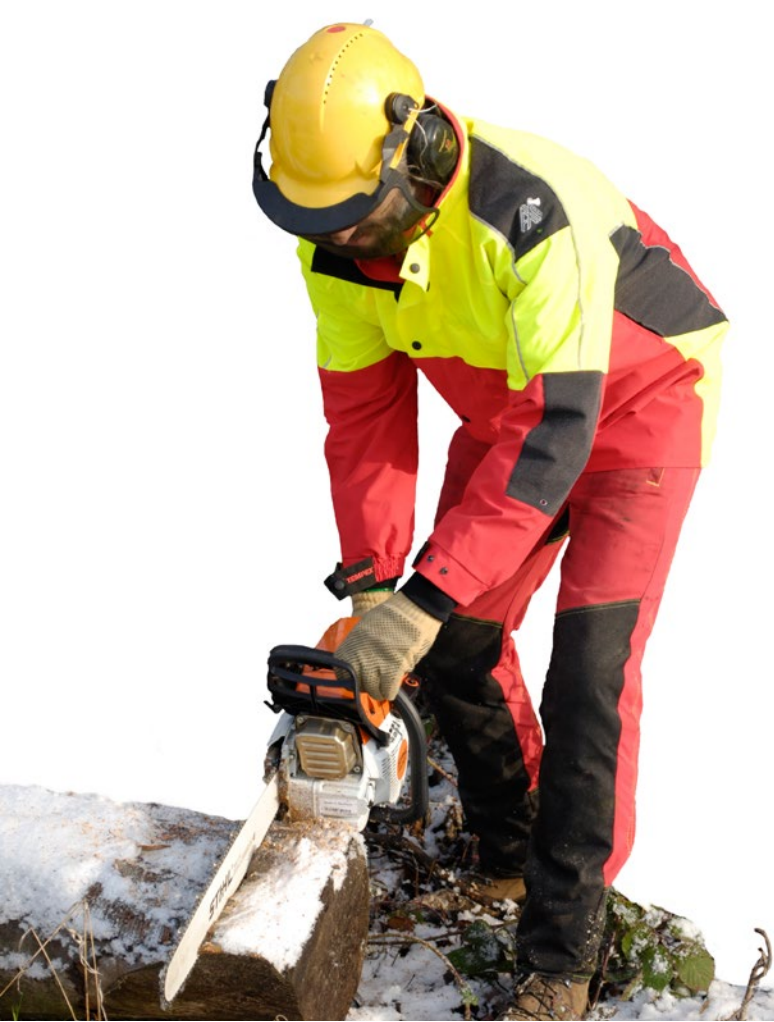
Abb. 9: Persönliche Schutzausrüstung am Beispiel der Forstarbeiten