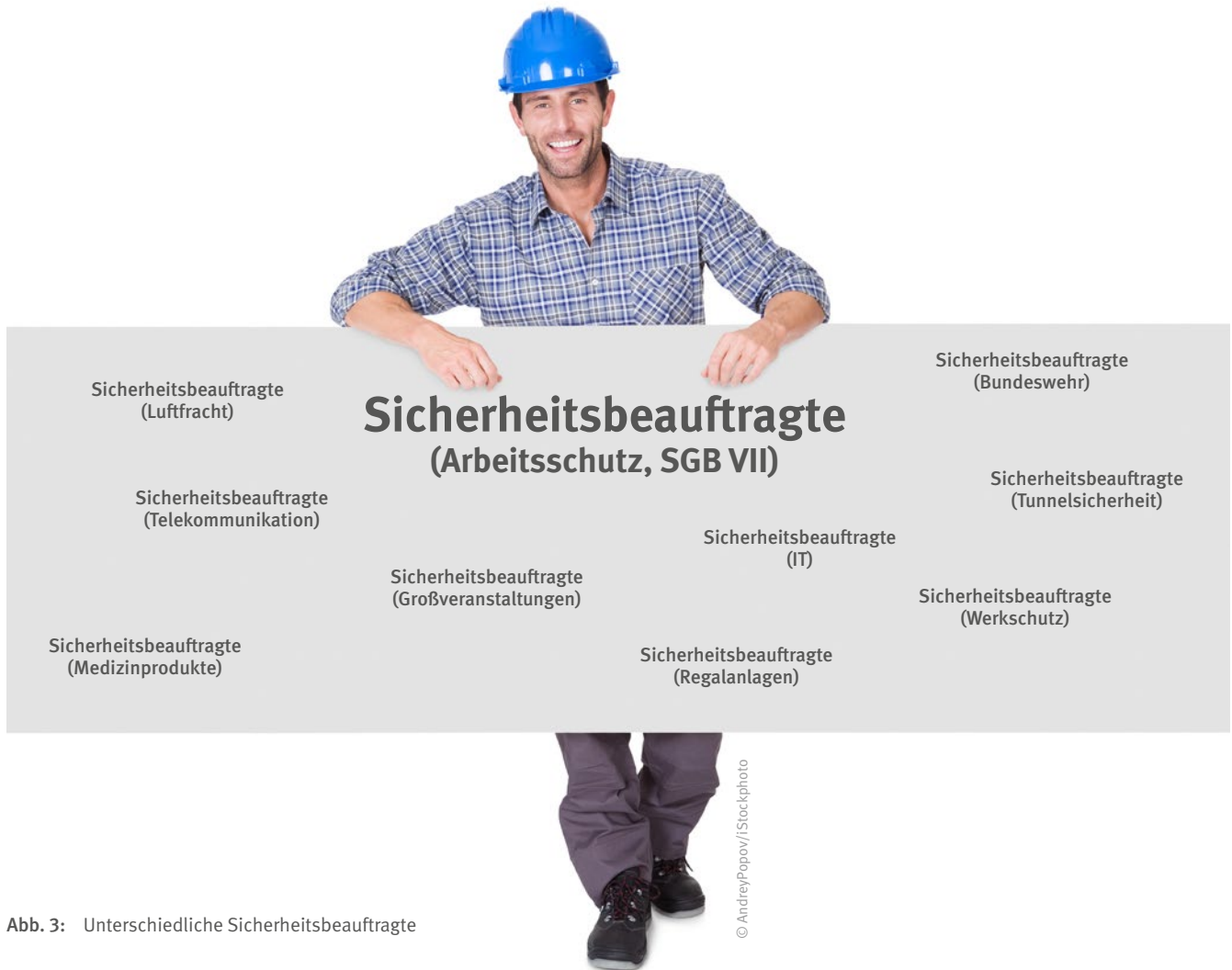
Abb. 3: Unterschiedliche Sicherheitsbeauftragte