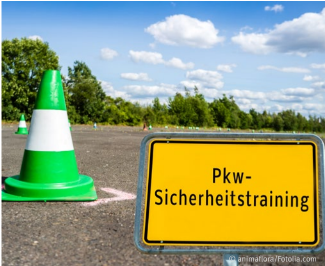
Abb. 10: Steigerung der Verkehrssicherheit durch Sicherheitstrainings

berücksichtigen. Besonders im Zusammenhang mit häufigem Termindruck verzeichnen die Berufsgenossenschaften und Unfallkassen ein erhöhtes Unfallgeschehen, weil die Dauer der Fahrt oft schlecht zu planen und die Strecke unbekannt ist.