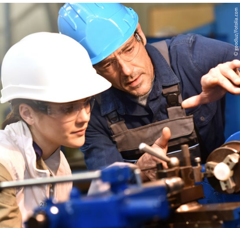
Abb. 15: Der Sicherheitsbeauftragte erläutert einer Auszubildenden das sichere Arbeiten an einer Drehmaschine